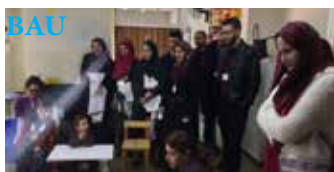
قسم الزوار والمتطوعين

مثل دائماً، كنا على موعد مع زوارنا الأعزاء طلاب الطب بجامعات BAU والـ AUB. هاللقاء اللي هدفو إنو يتعرفوا الشباب والصبايا على رسالة سيزوبيل وبرامج عملها هويّ كمان مساحة تا يطرحوا كل تساؤلاتن ويحملوا رسالة فحواها إنو شو ما كانت الإعاقة ولا ممكن تمسّ بكيان الإنسان.