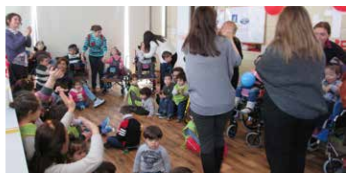
وحدة التدخّل المبكر