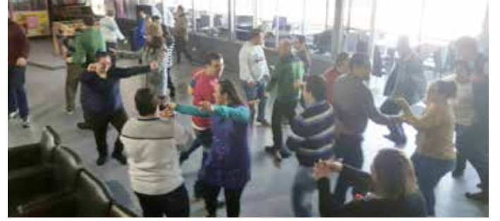
مركز المساعدة بالعمل

حاضرين دائماً بابتسامتن الحلوة وخدمتن المميزة حتى نكون نحنا فرحانيين. منشكرن من كل قلبنا على كل شي.