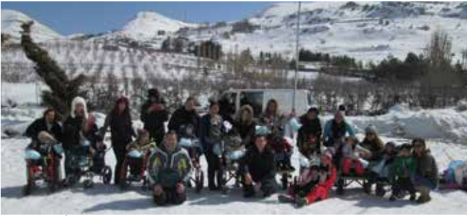
وحدة التدخّل المبكر