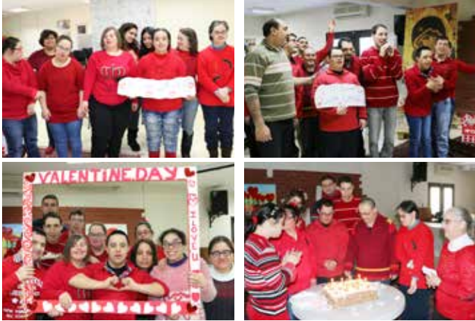
مركز المساعدة بالعمل