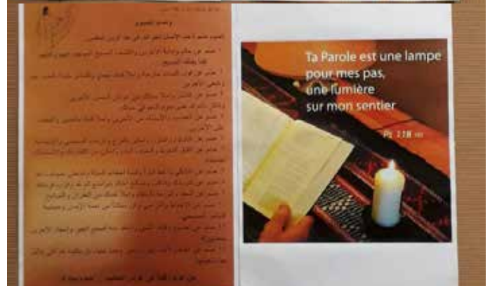
دولي غريشي - Ambiance de Vie