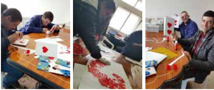
مركز المساعدة بالعمل - مشغل كفرحونا

وبما إننوا هالمناسبة عيد الأخوة والمحبة الصادقة والعيلة المتماسكة، حنرنا قلب كبير بإيدنا على أمل هالقلب يضل جامعنا إيد بإيد بكل الأيام لنكمل حب يسوع فينا. وأكيد ما نسويوا شيببتنا يعيدوا سيزوبيل بعيد الحب ويزرعوها بقلب كبير.